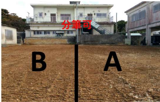
うちなーらいいふ