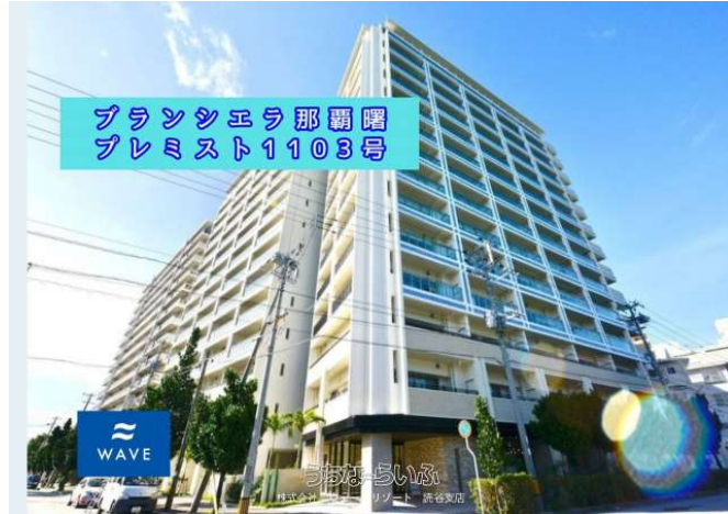
ブランシエラ那覇曙 プレミスト1103号

内覧予約受付中宿泊事業も可能な築3年のリゾートマンション海が一望でき見晴らしの良い11階のお部屋です