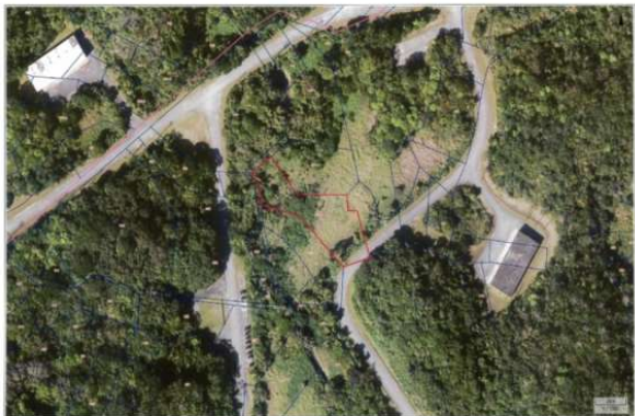
うちなーらいい この画像は衛星利用画像の表示です。地図の縮尺は任意で変更できます。

#嘉手納弾薬庫 #倍率55倍 #上昇率2.2% #宅地見込地 #年間借地料1,502,240円 人 気の弾薬庫出ました！