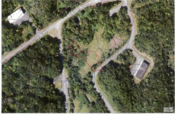
うちなーらいい この画像は衛星利用手帳の表示です。地図の縮尺は任意で変更可能ですが、正確な位置を示すものではありません。

#嘉手納弾薬庫 #倍率55倍 #上昇率2.2% #宅地見込地 #年間借地料1,502,240円 人 気の弾薬庫出ました！