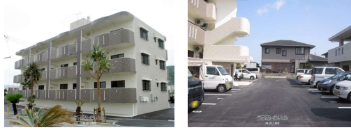
メゾンシオサイ契約駐車場 入居見解書

※内容は正確ですが、実際の入居状況により変更される可能性がありますのであらかじめご了承ください。