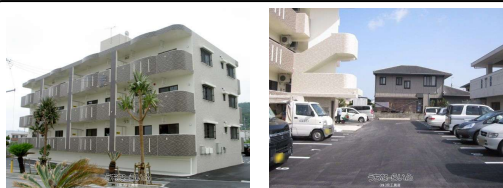
メゾンシオサイ契約駐車場 入居見積書

※内容は正確ですが、実際の入居状況により変更される可能性がありますのであらかじめご了承ください。