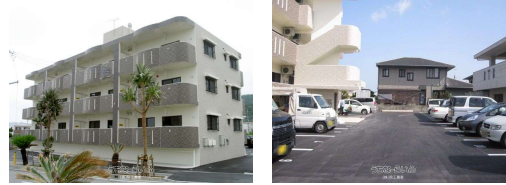
メゾンサイド契約駐車場 入居見様書