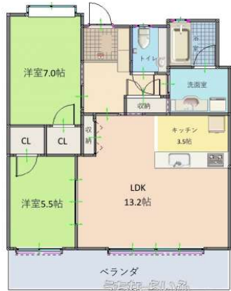
Tokurea rycom aqua terrace 503 ※現況と図面が異なる場合は、現況を優先します。

【オーナーチェンジ物件】賃貸中の収益物件です。【家賃収入20万円/(月)】イオンモールや、高速インターなども近く便利な立地です。近年人気のライカムエリアです！退去後は、自己使用も可能です。お気軽にお問い合わせください！