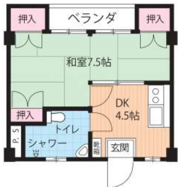
タカダ泊マンション 506(1DK)

近隣にコンビニ、マックスバリュ牧志店等があり、那覇新都心、国際通りにもアクセスやすく生活便利な地区です。モノレール牧志駅まで徒歩約9分です！