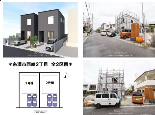
*糸満市西崎2丁目 全2区画*