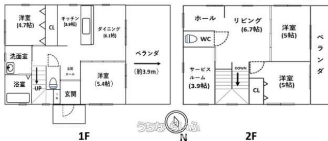
現況間取り図 (参考 ※現況と異なる場合は現況を優先)