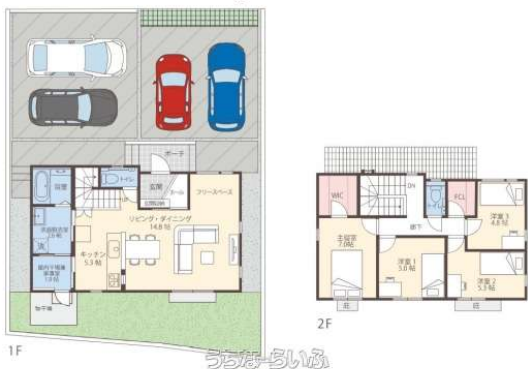
浦添仲間分譲プロジェクト2号地

売主直販のため仲介手数料0円！RC造の高耐久×南欧風デザイン！駐車2～4台OK◎浦添小・中学校近く、暮らしやすさ重視の提案住宅。資産価値の高い限定2棟、今だけ販売中！クローバーエース浦添仲間1号地